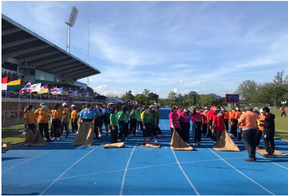
รูปภาพโครงการส่งนักกีฬาเข้าร่วมแข่งขัน