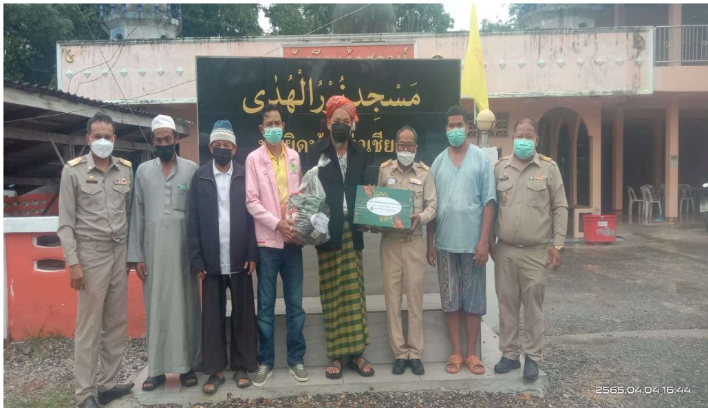
รูปภาพโครงการส่งเสริมกิจกรรมทางศาสนาของชาวมุสลิมในเดือนรอมฎอน