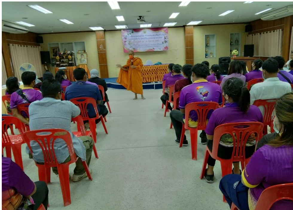
รูปภาพโครงการอบรมคุณธรรม จริยธรรมและเสริมสร้างวินัยในการปฏิบัติงาน