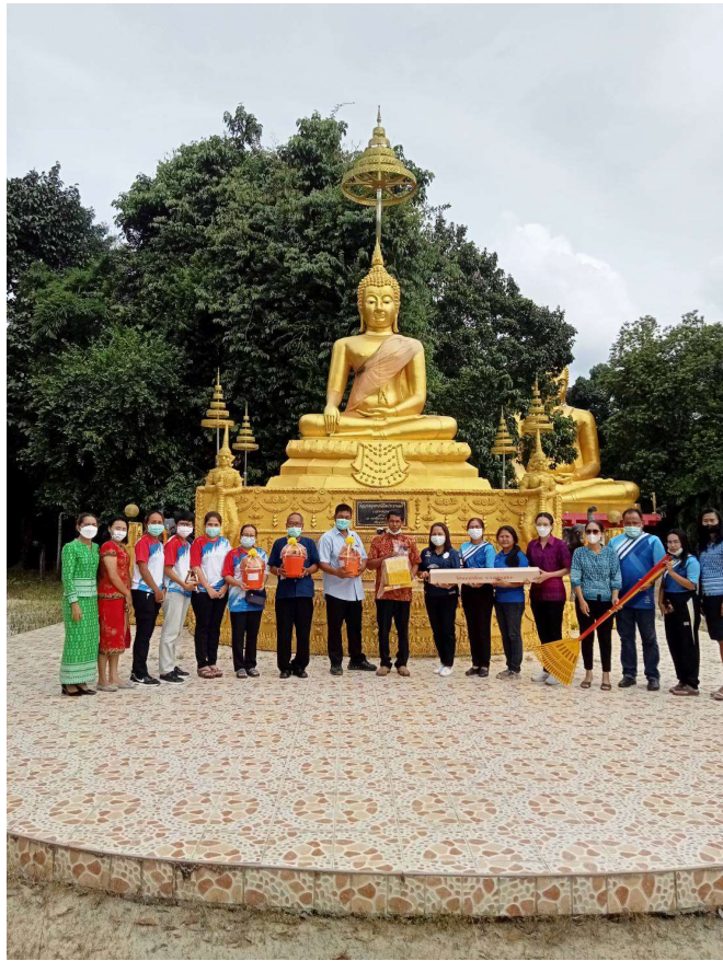
รูปภาพโครงการกิจกรรมวันเข้าพรรษา