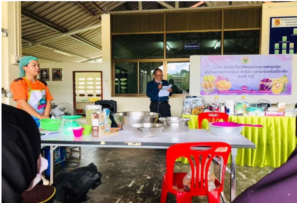
รูปภาพโครงการส่งเสริมอาชีพตามแนวทางเศรษฐกิจพอเพียง